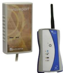
Waveport 868 MHz modemy USB verze Bluetooth verze