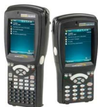
PSION WA PRO C Ruční odečtový terminál PSION Work About Pro C