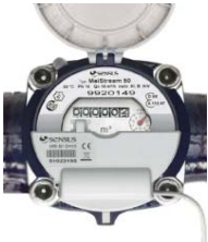
HRI-MEI Pro vodoměry MeiStream délky impulzů: 32, 128 nebo 500 ms