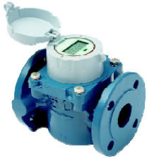
ELSTER H5000 HELIX WP

libovolná montážní poloha R 1250 (Q3/Q1) (možno 400 - 2000) Stavební délky pro WP i WS