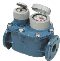
ELSTER C4000 INLINE WPV - kombinace

vodorovná montážní poloha R 630 - 2000 (Q3/Q1)