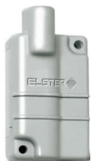
Waveflow 868 MHz Rádiový modul 868 MHz