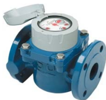
ELSTER H4000 HELIX WP

libovolná montážní poloha R 125 (Q3/Q1) (možno 63 - 160) Stavební délky pro WP i WS