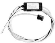
OPTO Pro vodoměry WP-Dynamic, WS-Dynamic, Meijet, Meitwin, WPVD, MeiStream