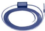
REED RD-01 Pro vodoměry WP-Dynamic, WS-Dynamic, Meijet, Meitwin, WPVD