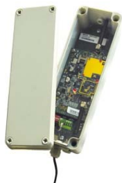
GSM Webdyn GSM brána pro radiomoduly 868 MHz